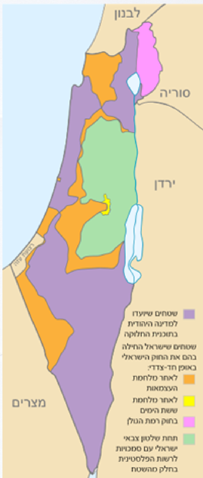
File:Israel Map by The Legal Status of The Territories.svg מויקיפדיה

גבולות המדינה לא נקבעו במגילת העצמאות, וחלקם עדיין זמניים ונתונים למחלוקת. (כמיטב המסורת היהודית, המועדדת מחלוקת כל עוד היא לשם שמיים...) גם חוקי המדינה עדיין לא נחקקו בחוקה.