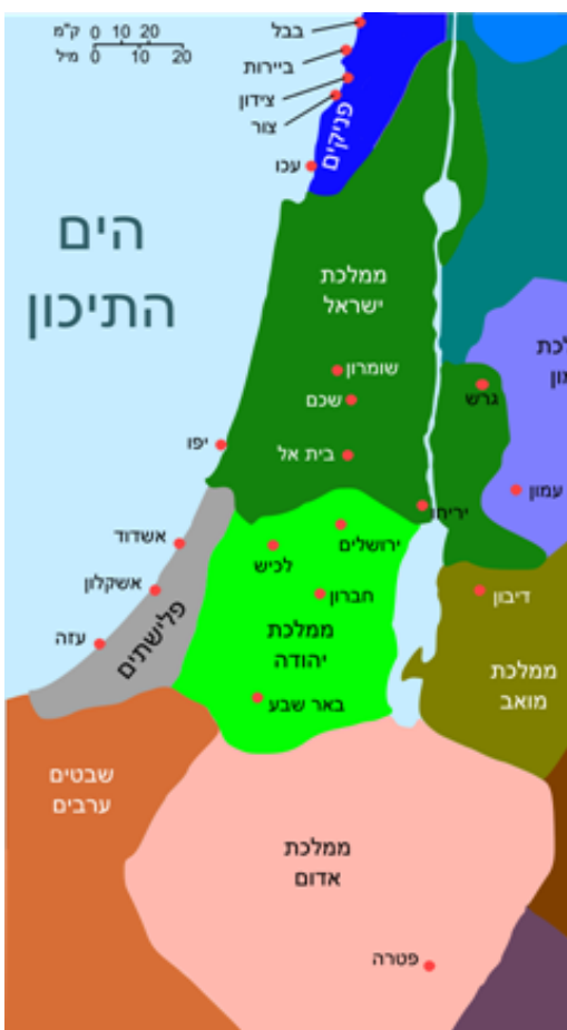
File:Levant 830-HE.svg מויקיפדיה

ממלכת יהודה היא הממלכה הדרומית יותר. בירתה ירושלים , ובה היה בית המקדש. מלכו בה מלכים מבית דוד. ממלכת ישראל הוקמה לאחר מרד ברחבעם, בנו של שלמה המלך. "מָה לָנוּ חֵלֶק בְּדָוִד וְלֹא נַחֲלָה בְּבֶן יִשְׂרָאֵל, לְאֶהֱלִיךָ יִשְׂרָאֵל" אמרו והלכו.